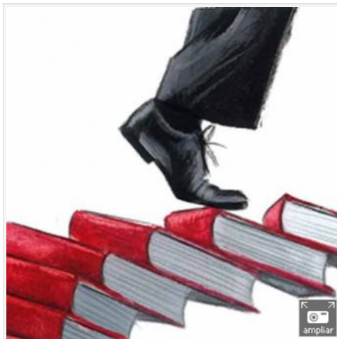
Ilustraciones de Fernando Vicente.-